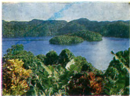
Вид из окна отеля «Континенталь»