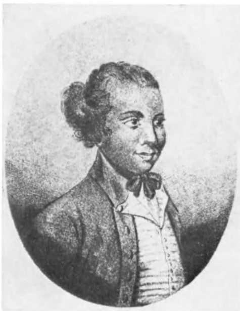
Князь Ли Бу с острова Корор

Так выглядела ныне несуществующая древняя колоннада