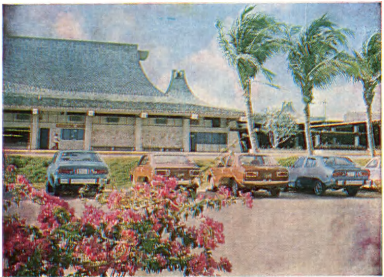
Сайпан. Здание современного аэровокзала