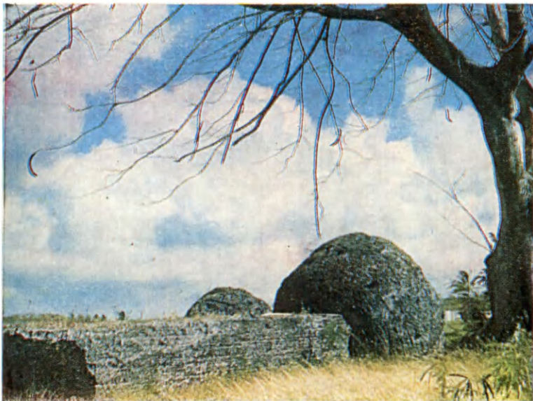
Тиниан. Древние сооружения островитян, разрушенные артиллерией во время второй мировой войны Последняя дошедшая до наших дней древняя загадочная колоннада на Тиниане