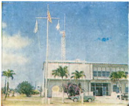
Сайпан. Административное здание на Капитолийском холме