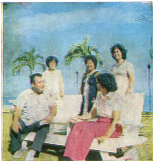
Сайпан. Скала самоубийц

В наши дни островитяне уже не носят традиционную одежду